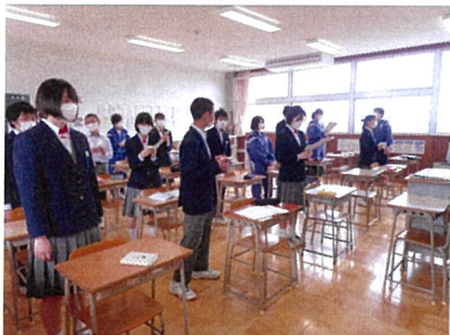
【生徒会主催 生徒朝会】

5月7日に授業を再開し、非常事態宣言の解除も踏まえ、学校では段階的に教育活動を通常に戻すことを視野に入れながら、日々生活しております。保護者の皆様には多大な協力をいただき、感謝申し上げます。生徒の姿に、私達教職員一同「日常のありがたさ」を痛感しています。困難なことが多いですが、一步一步生徒の成長のために、尽力してまいります。